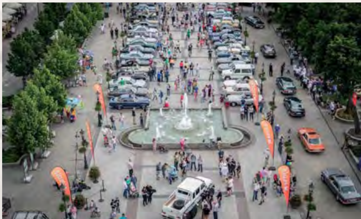
Mercedesy w 2017 roku prezentowane były na Starym Rynku. W tym roku będzie można je oglądać na ul. Tumskiej

Zlot zawsze zaczyna się od tradycyjnego rejsu uczestników statkiem po Wiśle. W tym roku