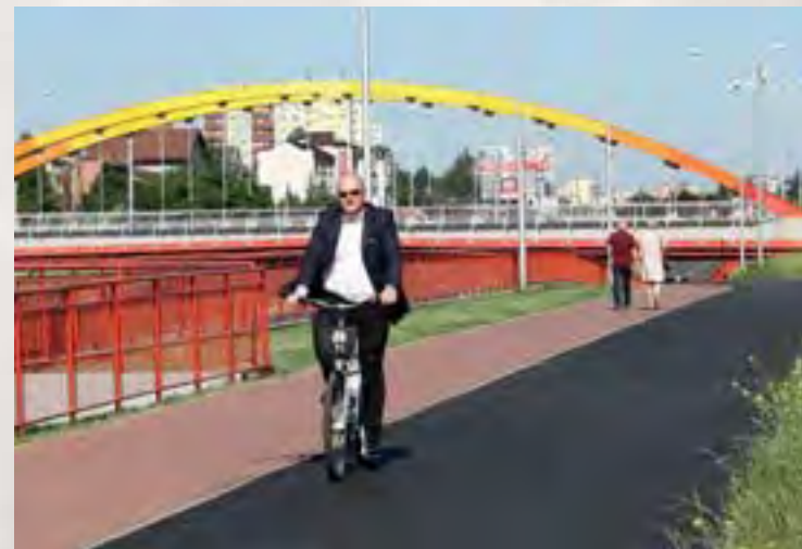
Magistrala rowerowa połączy Podolszyce z centrum miasta

Od czasów, w których po Tumskiej na bocyklu mógł jeździć Broniek, przybyło też w Płocku dróg, po których można bezpiecznie podróżować na dwuśladach. Latem gotowa będzie magistrala rowerowa, która połączy Podolszyce z centrum miasta. W ostatnim czasie zakończyła się budowa trasy rowerowej na Radziwiu. Droga o długości 2,5 km biegnie od wału przy Wiśle, poprzez ulice Kolejową, Portową i Popłacińską do granicy miasta. W całym mieście dróg rowerowych w ostatnich latach przybyło nam kilkakrotnie. W 2011 roku było ich 11 km, wkrótce będzie prawie 70 km.