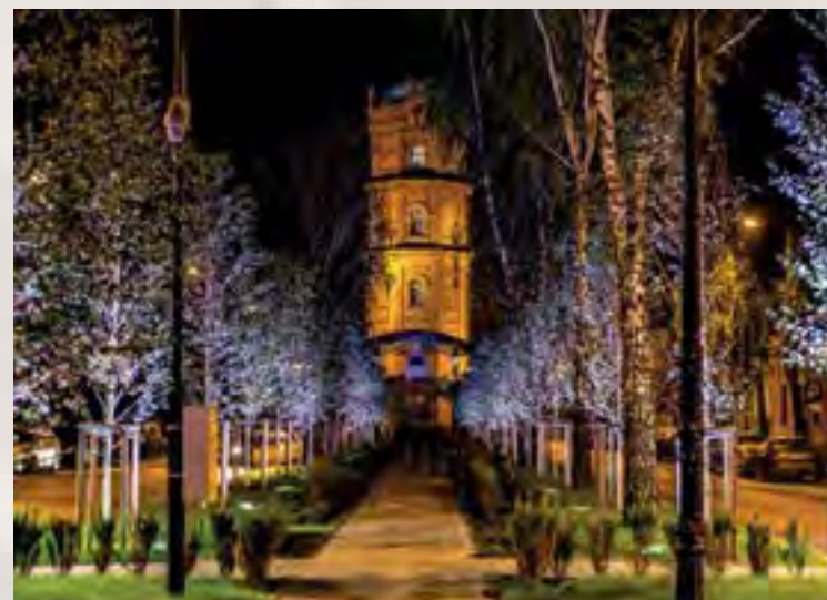
Wieża Ciśnień i skwer przy pl. Dąbrowskiego

Nowe domy staną także w miejscu istniejących aktualnie w głębi oficyn. Na tym odcinku powstanie kilkadziesiąt kolejnych mieszkań. Podobnie jak te na wspomnianym wcześniej odcinku ulicy, będą przeznaczone na wynajem w ramach adresowanego do młodych ludzi programu „Mieszkania na start”. W sąsiedztwie budynków mieszkalnych mają powstać place zabaw i skwery.