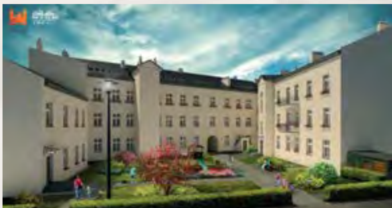
Kamienica przy ul. Sienkiewicza 38 po modernizacji – wizualizacja

Aktualnie trwa remont kamienicy przy Sienkiewicza 38. W okazałym gmachu powstaną „Mieszkania na start”. Do dyspozycji młodych płocczan oddanych będzie 30 lokali