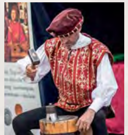
Fot. Jarmark Tumski 2017