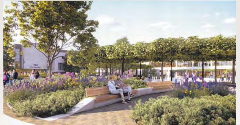
Nowy Rynek – wizualizacja

Podczas Jarmarku Tumskiego wystawców i zwiedzających można spotkać także na placu Nowy Rynek. Na przyszłoroczną edycję imprezy to miejsce będzie wyglądać już zupełnie inaczej.