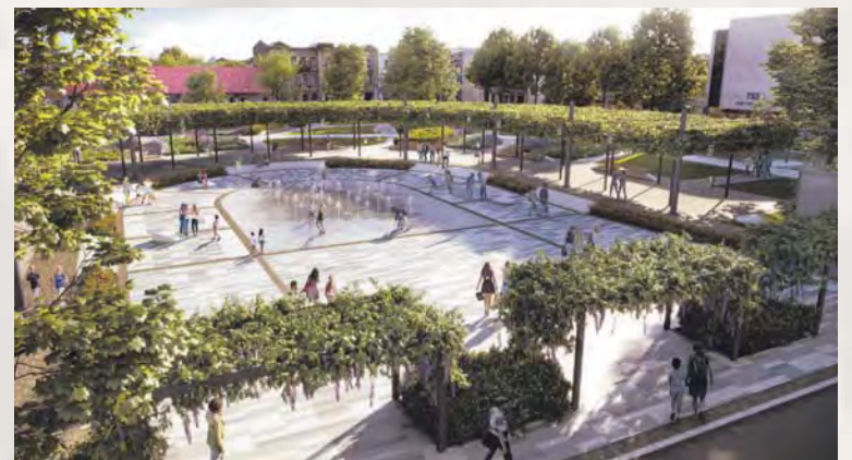
Nowy Rynek – wizualizacja

Przedsięwzięcie będzie realizowane w latach 2018-2019. W tym roku w budżecie miasta na to zadanie przeznaczony jest 3,5 mln zł, a w 2019 roku – 9 mln zł. Plac ma być gotowy do 31 maja 2019 r.