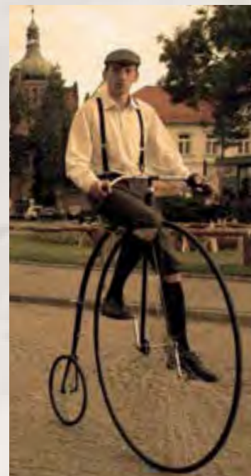
Dni Historii Płocka 2012 r.

Umowa na wprowadzenie Systemu Płockiego Roweru Miejskiego, czyli po prostu rowerów na wynajem, jest już podpisana. Pojazdy przyjadą do Płocka najprawdopodobniej w sierpniu. Będzie ich w sumie 250, rozmieszczonych na 25 stacjach rowerowych. System będzie działał od początku kwietnia do końca listopada, przez całą dobę we wszystkie dni tygodnia. Użytkownicy będą mogli korzystać z roweru przez pierwsze