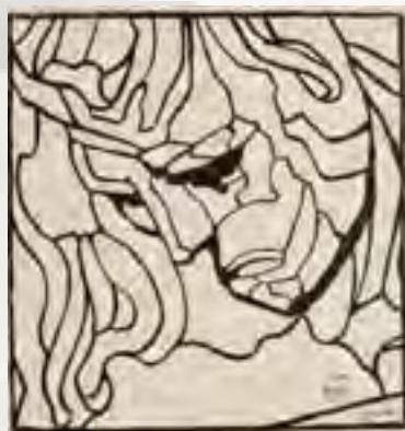
Wystawa „W labiryncie wrażeń” – Stanisław Wyspiański, Głowa Apollina, 1904, litografia, papier