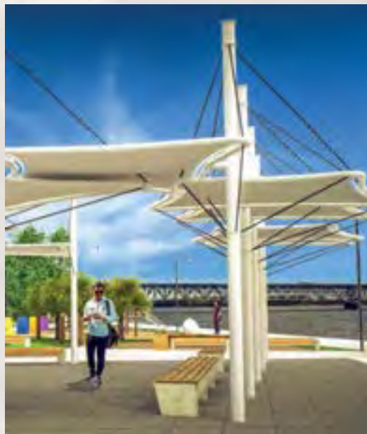
Wizualizacja nowego nabrzeża

będzie chronić to miejsce przed tzw. cofką i odepchnie główny nurt rzeki od prawego brzegu. Drugi falochron – prostopadły do rzeki – powstanie w miejscu istniejącej ostrogi. Wartość przedsięwzięcia to ponad 32 mln zł.