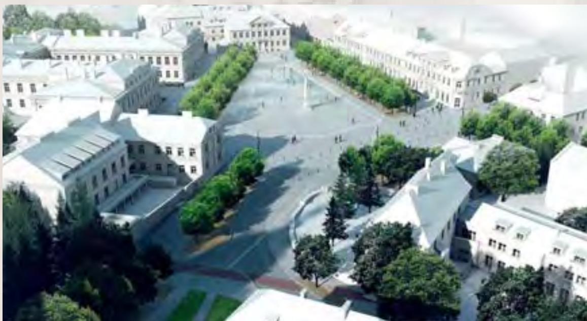
Plac Narutowicza – wizualizacja