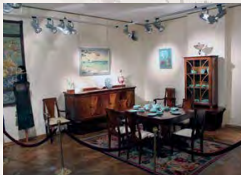
Muzeum Mazowieckie – ekspozycja art deco

to 3 417 962,58 zł przy wartości projektu równej 12 998 945,00 zł.