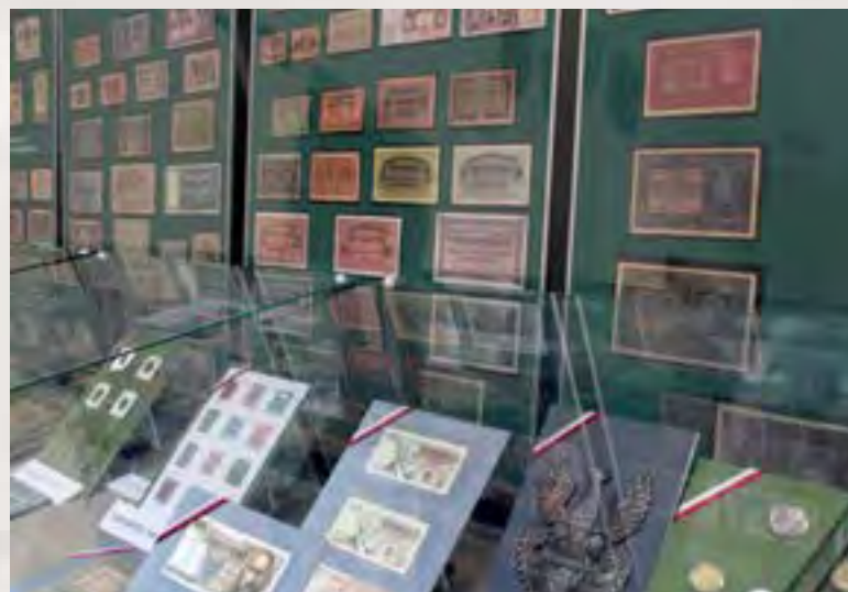
Wystawa „Świadkowie tamtych lat”