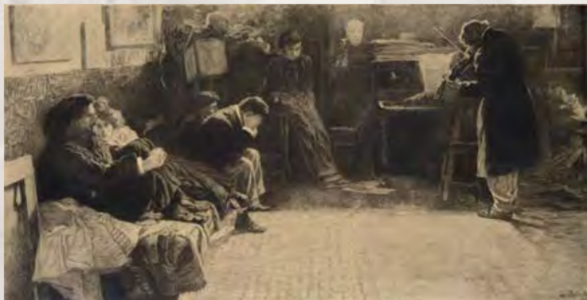
Wystawa „W labiryncie wrażeń” – Lionello Balestrieri, Koncert, 1900, akwaforta, papier

Przy okazji warto dodać, że podczas gdy płocczanie będą uczestniczyć w Jarmarku Tumskim, wciąż trwać będą prace nad naszymi najnowszymi inwestycjami. W 2017 roku Muzeum Mazowieckie w Płocku pozyskało środki unijne w ramach Regionalnego Programu Operacyjnego Województwa Mazowieckiego na lata 2014-2020 i rozpoczęło inwestycje związane z rozbudową Skansenu Osadnictwa Nadwiślańskiego w Wiączeminię Polskim oraz wystawą art deco, na potrzeby której wyremontowana zostanie kamienica przy ul. Kolegialnej 6. Pozyskane dofinansowanie na skansen w Wiączeminię wynosi 3 337 229,11 zł przy całkowitej wartości projektu 7 264 352,12 zł. W przypadku budynku przy Kolegialnej 6 dofinansowanie